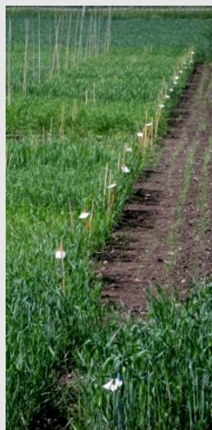
Blé génétiquement modifié et plantes des contrôle sur le champ expérimental de Reckenholz