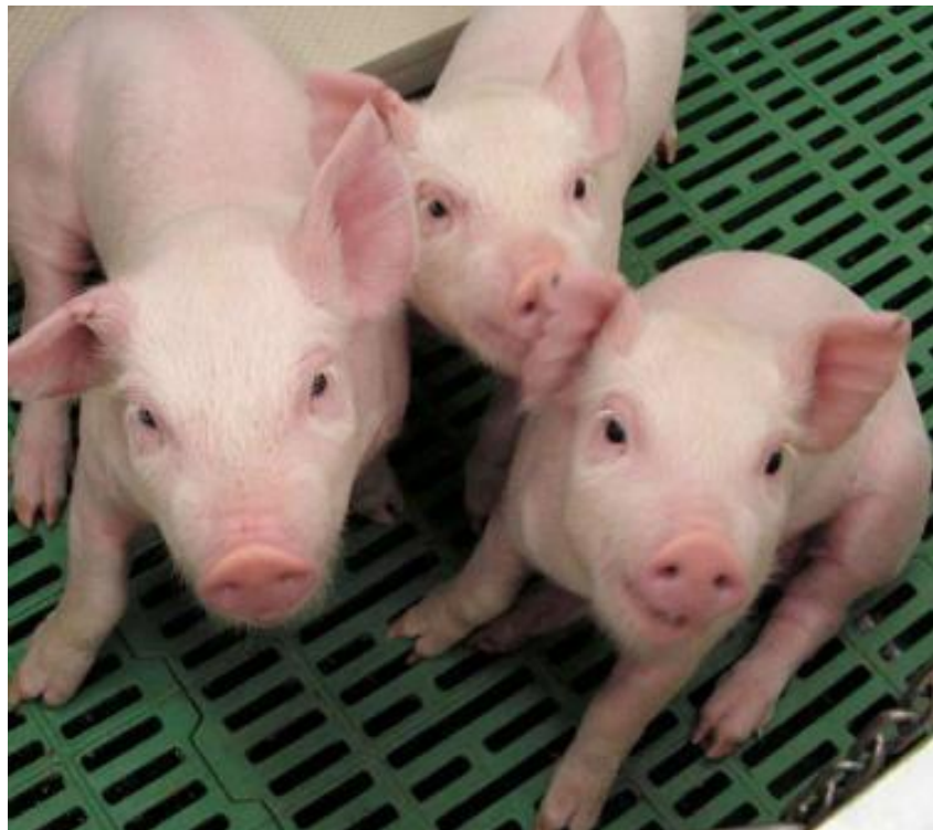
Gentechnisch veränderte Ferkel mit erhöhtem omega-3-Fettsäuregehalt im Fleisch, zusammen mit einem nicht transgenen Ferkel aus dem selben Wurf ( links).

Eine Gruppe von US-amerikanischen Forschern hat nun einen neuen Weg beschritten, um die Qualität von Schweinefleisch für die menschliche Ernährung zu verbessern. Sie verwendeten ein Gen aus dem Fadenwurm C. elegans , welches diesem die Fähigkeit verleiht, omega-6-Fettsäuren in